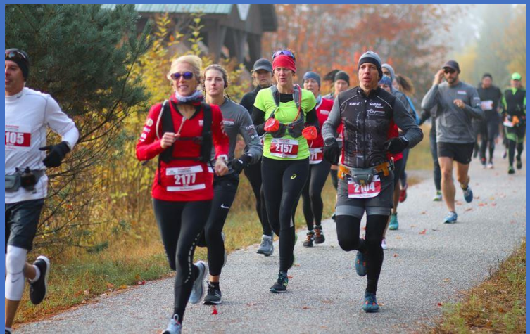
SUCCÈS POUR LE MARATHON DESJARDINS DE LA VALLÉE DE LA ROUGE

C'est le 13 octobre dernier qu'a eu lieu le marathon tant attendu. Plus de 760 participants sont venus participer à la course. Une hausse de participation de plus de 13% vs 2018. Jeunes et moins jeunes, femmes et hommes. Le succès fut tel, que l'organisation a dû refuser les inscriptions de dernière minute.