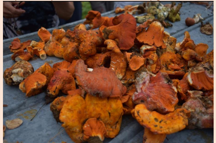
Dermatose des Russules (communément appelé homard)

Les cueilleurs à l'écoute de Monsieur Brien, sur les endroits les plus susceptibles de trouver des champignons.